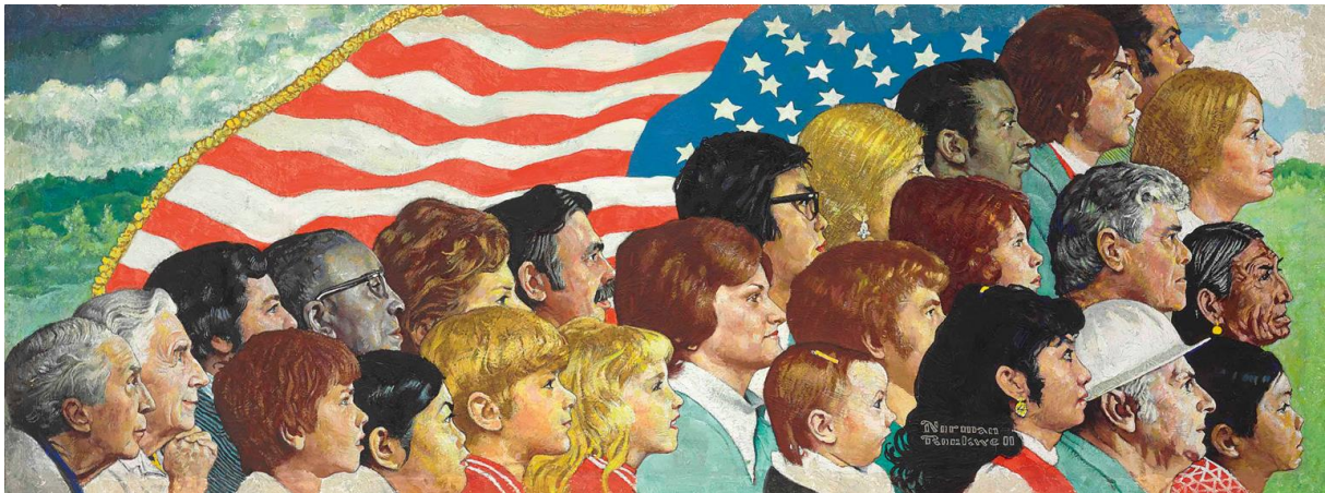
Norman Rockwell, Spirit of America , 1974

Look at Norman Rockwell's painting: what does it say about the American nation? Why do people choose to leave their country and start a new life in the USA nowadays?