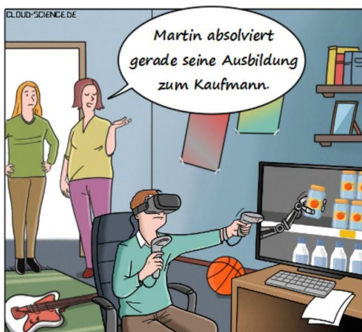
The New Normal