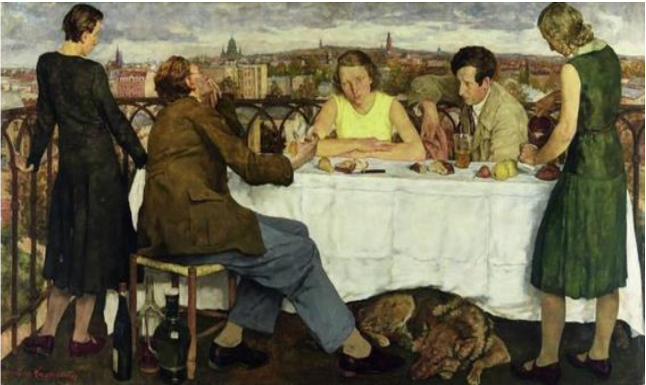
Lotte Laserstein, Abend über Potsdam , 1930. Nationalgalerie Berlin