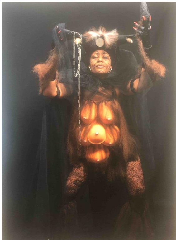
Daniel DABRIOU, Le carnaval en Guadeloupe, VIM, Editions Kaéra, 2012

On vyémisyé ka rakonté : « On jou swa, adan on katchimen an vin fasadé épi madanm-la asi zimaj-la. An pran pè ..... »