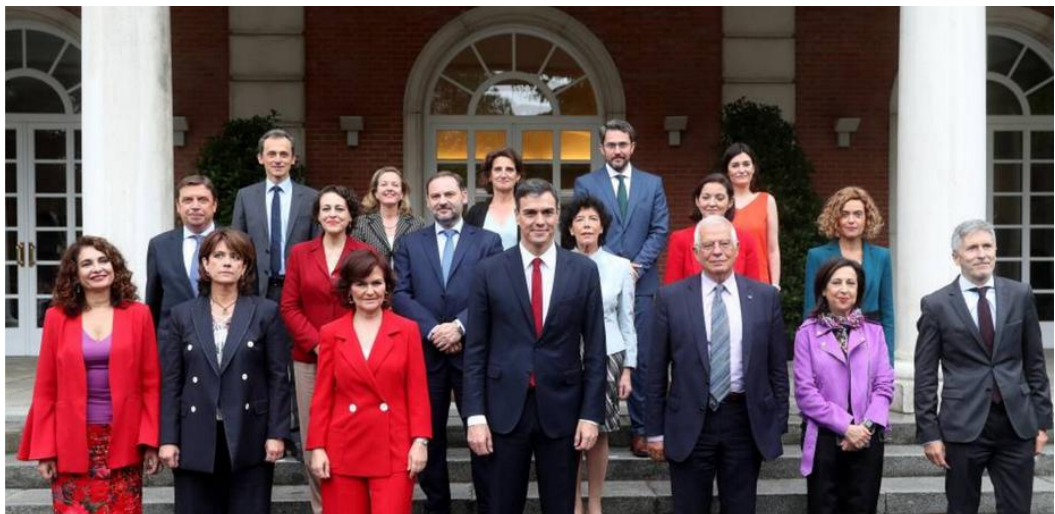
El gobierno que formó Pedro Sánchez en el mes de junio 2018

5 La llegada a la Moncloa 1 de un nuevo gobierno socialista cambió el paisaje nacional y adquirió también un papel relevante en la visibilización de la mujer [...] El Gobierno de Pedro Sánchez es el que mayor proporción de mujeres ha tenido en la historia de España, el que más tiene en Europa y el mundo occidental [...] 11 de los 18 puestos que tiene el Gobierno (incluido el presidente) están encabezados 2 por mujeres, el 61% del total, un margen mayor que el que obliga la Ley de Igualdad de 2007. Además, el propio presidente Pedro Sánchez es un autoproclamado feminista.