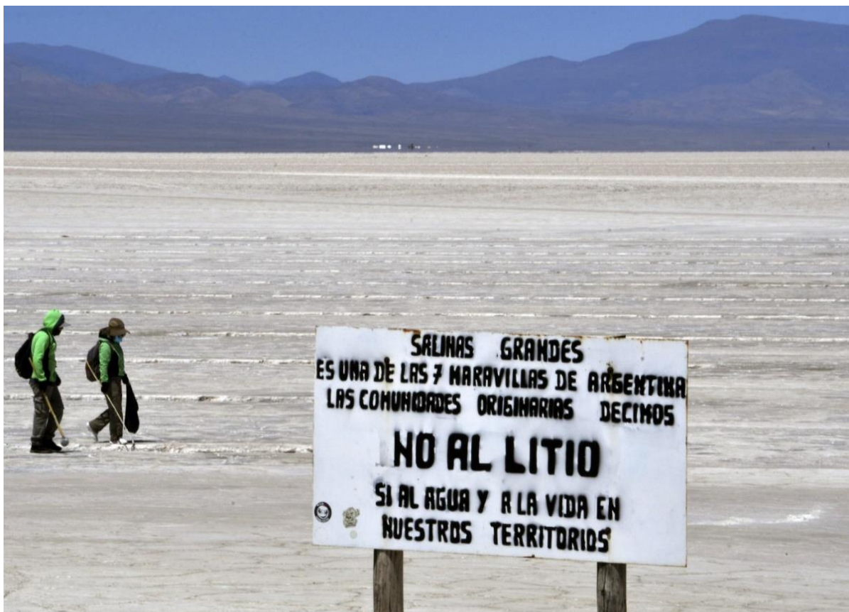
Cartel en el salar Salinas Grandes, Argentina, 18 de octubre de 2022.