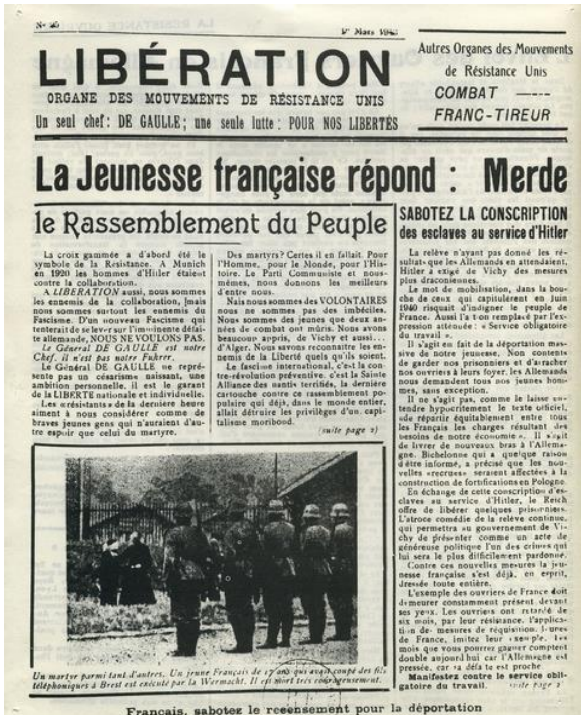
Document 2 : la « Une » du journal Libération , n° 25, 1 er mars 1943.