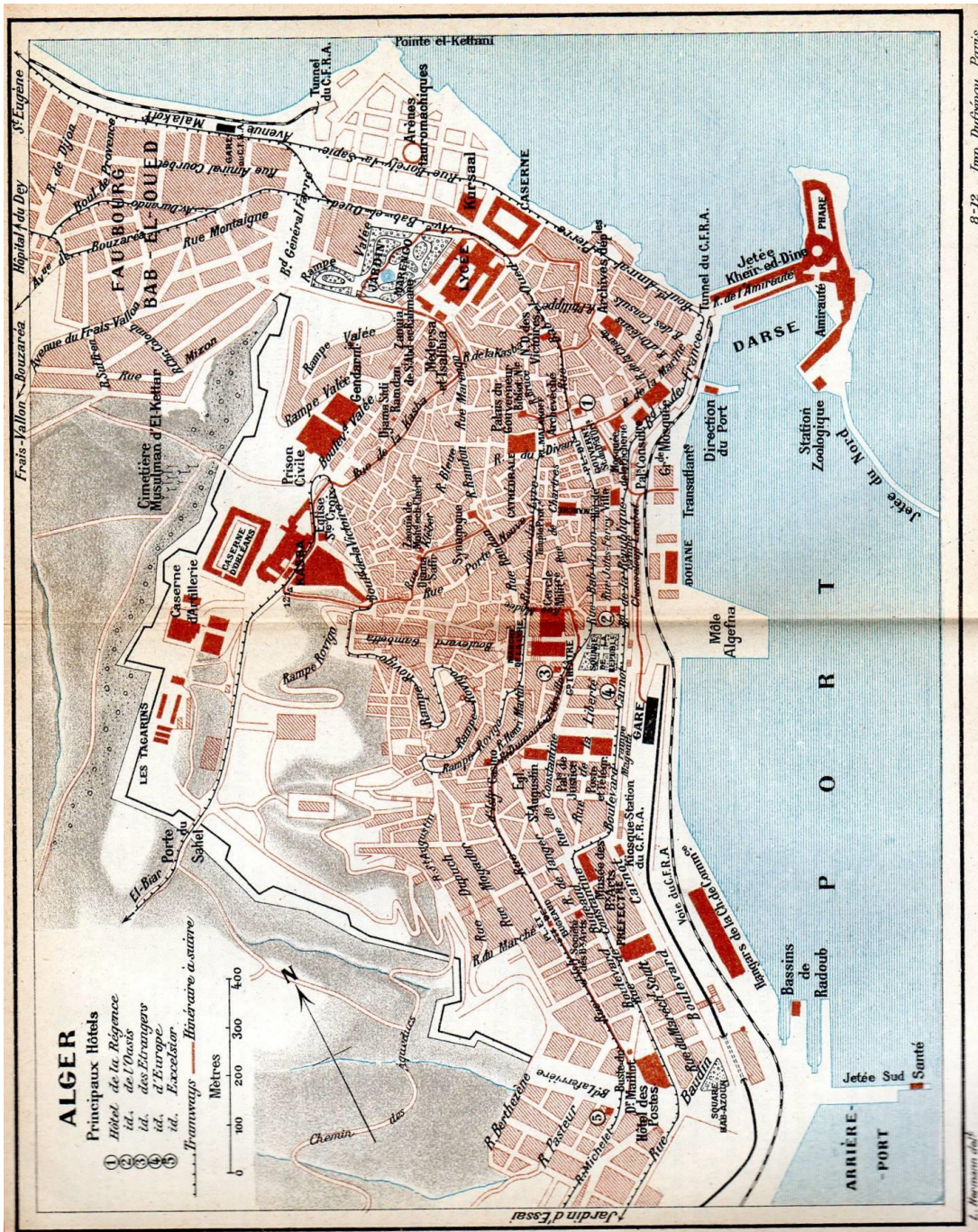
Document 1 : Plan d'Alger