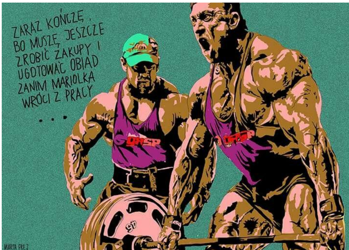
Źródło: Memy i graffy, Agnieszka Graff, Marta Frej