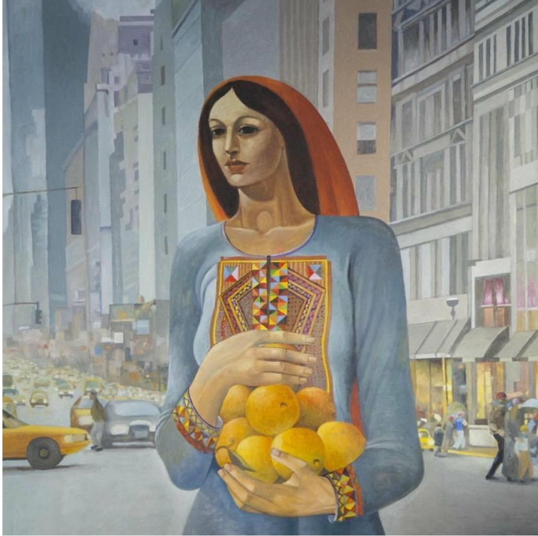
لوحة "المغتربة" للفنان الفلسطيني سليمان منصور 2017