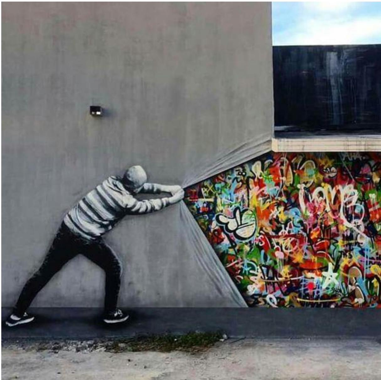
Martin Watson, Behind the Curtain , mural painting in Miami, Florida, 2015