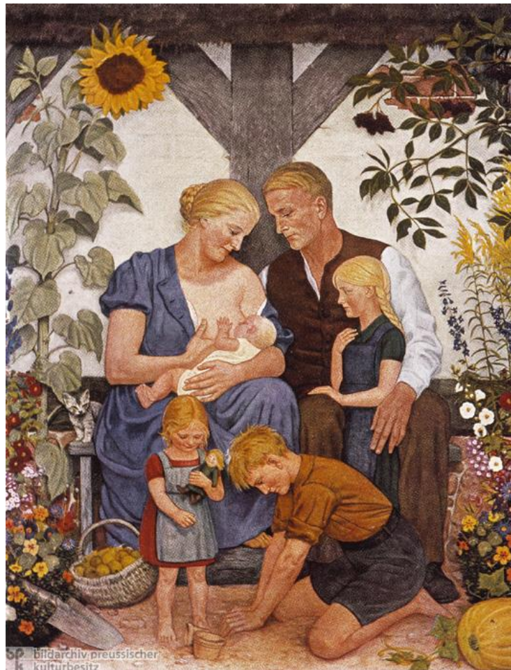
Gemälde: Wolfgang Willrich, Die Arische Familie , um 1938