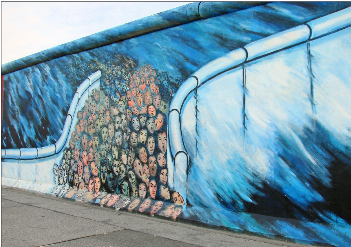
Source: Wandbild von Kani Alavi: „Es geschah im November“ East Side Gallery, Berlin Kreuzberg, 1991