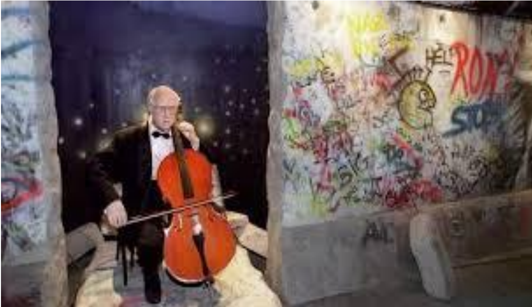
“Mauern sind nicht für ewig gebaut. In Berlin habe ich für mein Herz gespielt“, der Cellist Rostropowitsch am 11.November 1989.