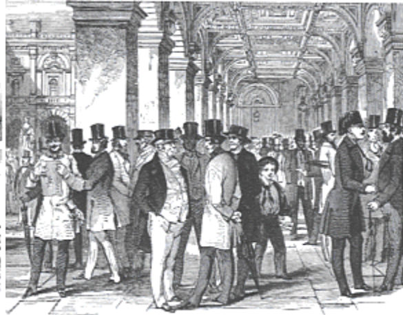
Privatsphäre der Männer und Frauen Abb.: England, 1845 - 1847