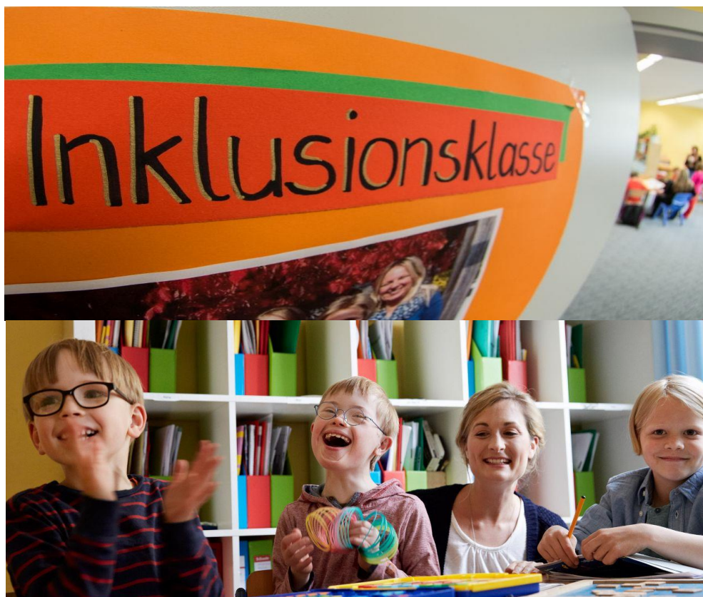
Inklusionsklasse an einer Grundschule