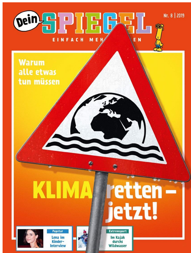
Titelseite – Dein Spiegel – August 2019 Klima retten – jetzt !