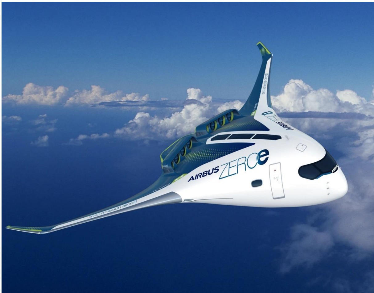
Bild – Das Wasserstoffflugzeug ZEROe: Airbus plant eine Revolution für Kurzstreckenflüge Das Flugzeugsprojekt 2035 mit Null CO 2 -Emissionen www.rnd.de/wirtschaft/