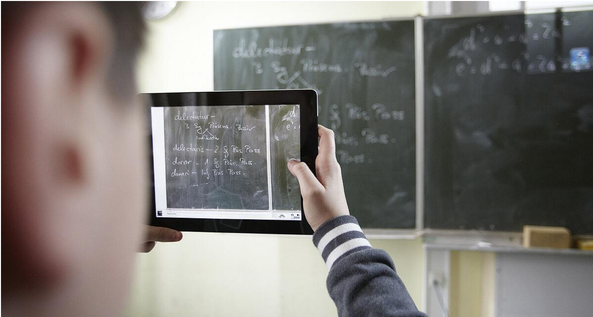
Foto – Digitalisierung an Schulen, Berlin, Juni 2020 Wie Schüler und Lehrer mit privaten Geräten die Corona-Krise meistern

www.gew.de/aktuelles/detailseite/neuigkeiten/ein-hoch-auf-das-improvisationstalent/