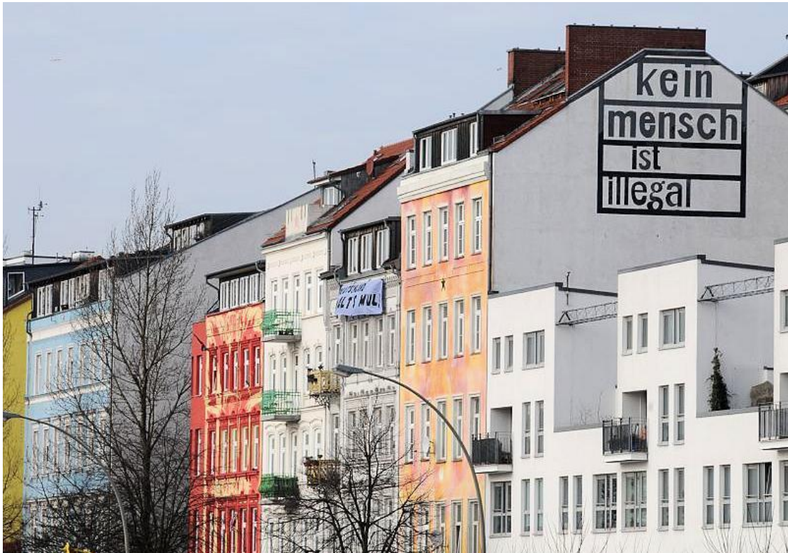
Foto – Street Art in Hamburg