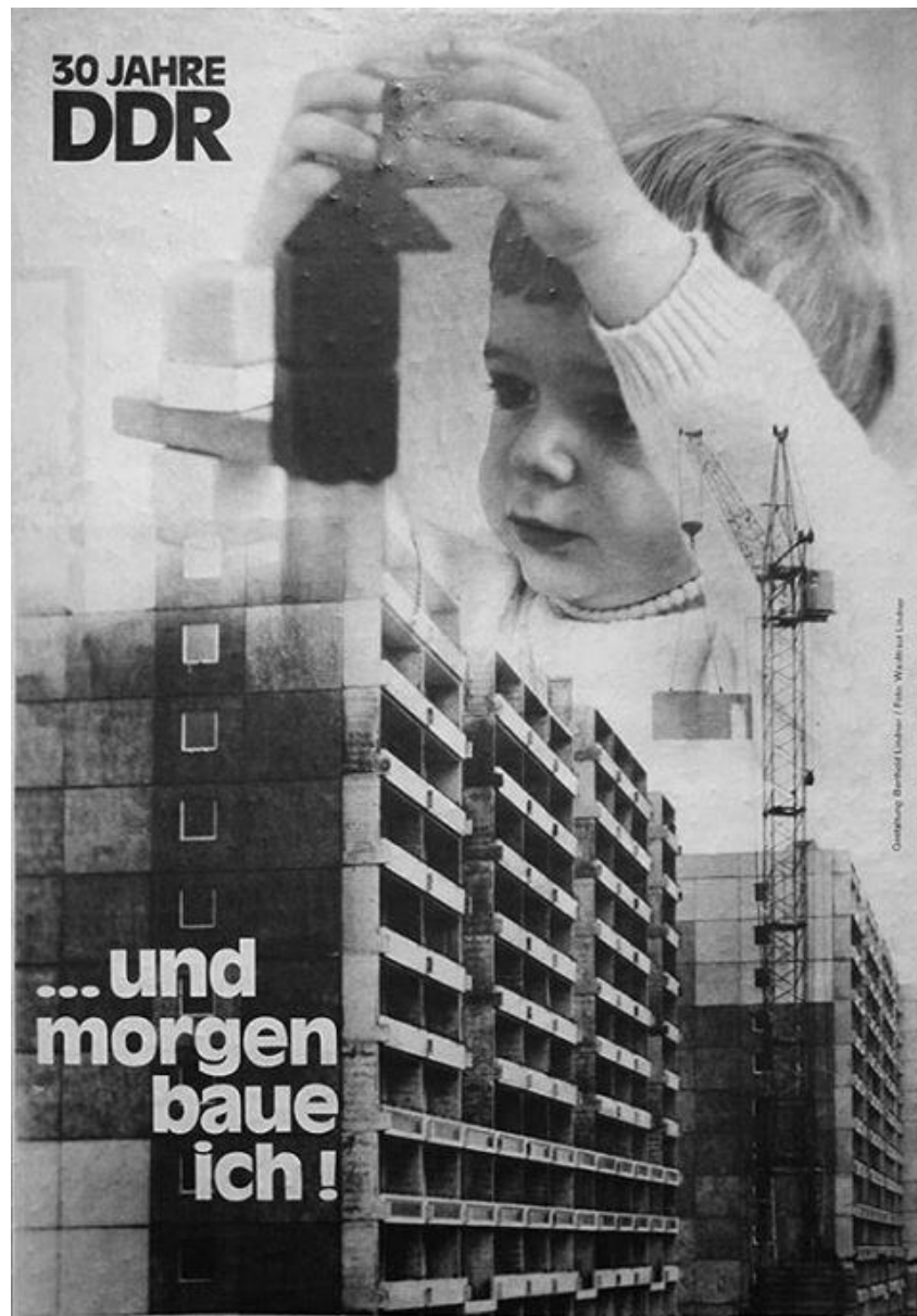
Plakat – DDR-Propaganda, 1979

Bau von Neubausiedlungen als politisches Projekt in den 70er und 80er Jahren