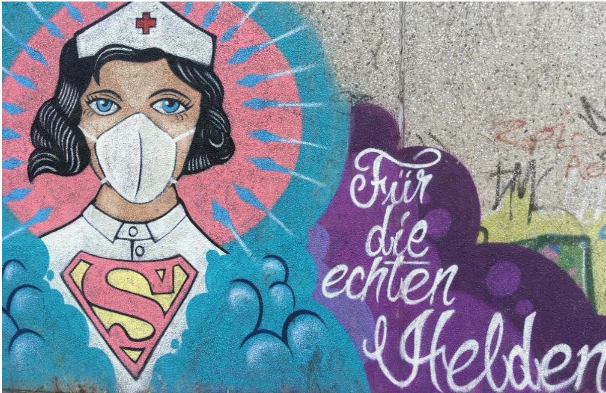
Foto – Street Art in Hamm