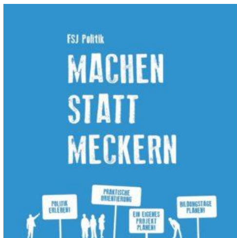
FSJ Politik - Machen statt meckern (meckern: râler)

Viele Jugendliche engagieren sich in ihrer Freizeit in einer Hilfsorganisation oder machen ein Freiwilliges Soziales Jahr (FSJ). Und Sie, wären Sie auch bereit, so etwas zu machen? In welchem Bereich?