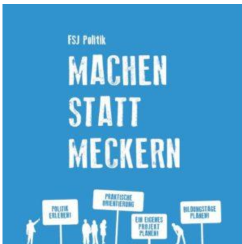
FSJ Politik - Machen statt meckern (meckern: râler)

Viele Jugendliche engagieren sich in ihrer Freizeit in einer Hilfsorganisation oder machen ein Freiwilliges Soziales Jahr (FSJ). Und Sie, wären Sie auch bereit, so etwas zu machen? In welchem Bereich?