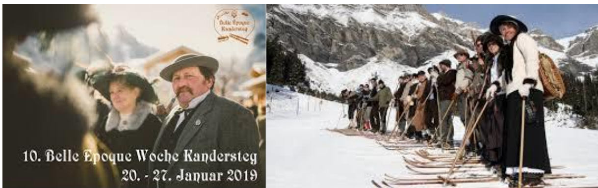
Nostalgiewoche in Kandersteg

Melanie Helmers – Presse und Sprache - Januar 2019