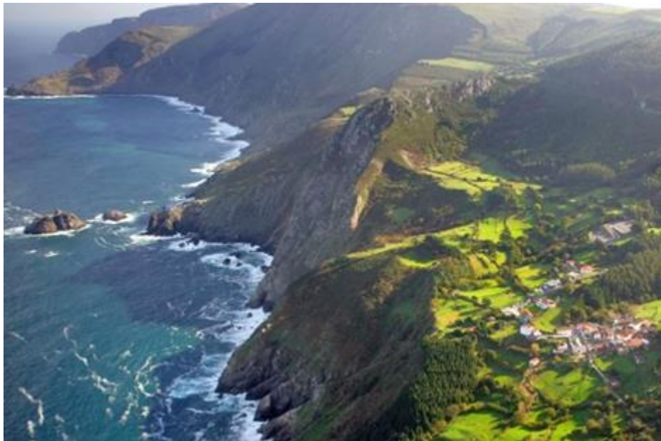
A Costa da Morte, un lugar maldito para los marineros, El Mundo , 12/02/2012

Las leyendas se basan en hechos y personajes reales o parcialmente reales. Demuéstrelo apoyándose en el texto y en esta fotografía de la costa gallega.