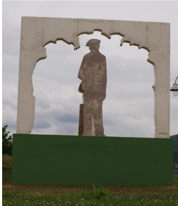
Andrés Montesanto, El inmigrante , 2014