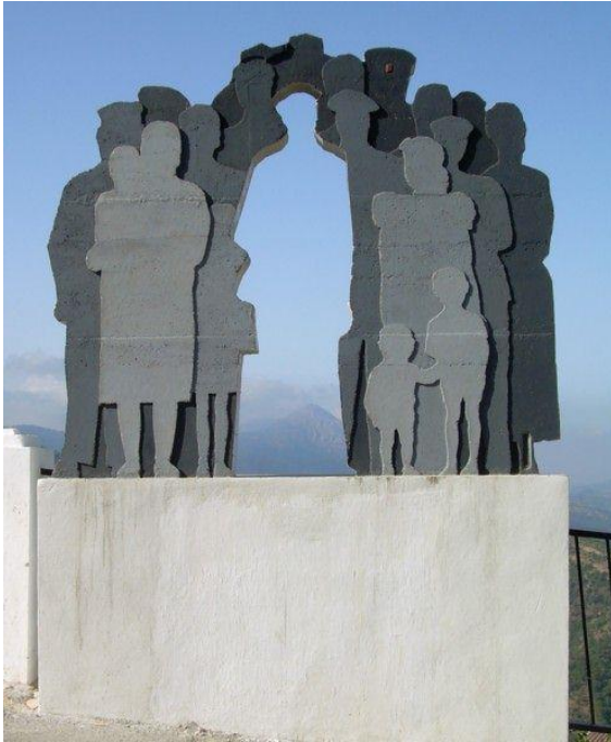
Andrés Montesanto, El emigrante , 2008