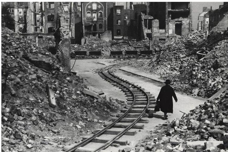
„Die Stunde Null“, Ritterstraße in Köln um 1947

Erklären Sie, warum es wichtig ist, dass wir uns heute noch an die Vergangenheit erinnern. Sie können sich dabei auf das Foto stützen.