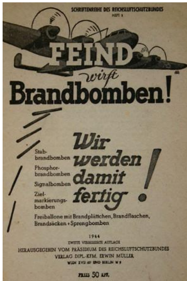
Wir werden damit fertig , Propaganda-Broschüre des Reichsluftschutzbundes, 1944