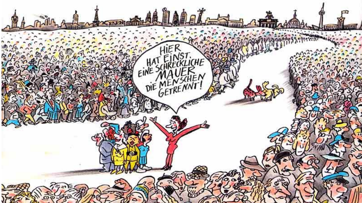
Abbildung: Grenze zwischen Ostdeutschland und Westdeutschland

HENNINGER B., „20 Jahre Mauerfall“, Spiegel Online, 4.11.2009