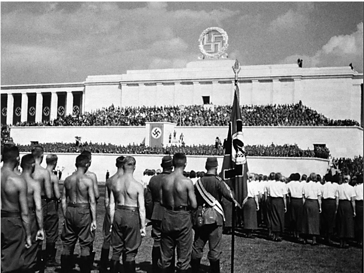
Document 2 : Congrès de Nuremberg, photographie de Hugo Jaeger, 1937.

Note: le parti nazi se réunit chaque année à Nuremberg entre 1933 et 1938.