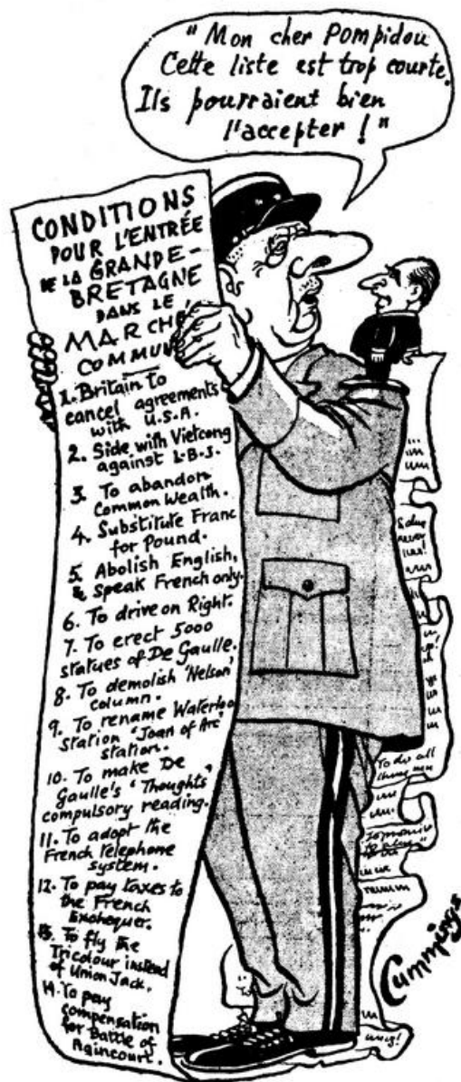
Document 2 : caricature anglaise sur les conditions pour l'entrée de la Grande-Bretagne dans le Marché commun