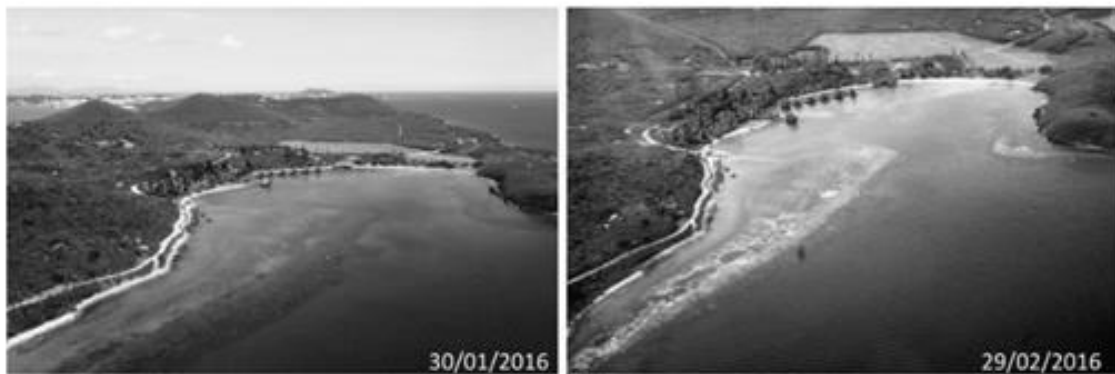
Figure 1 - Comparaison des deux vues aériennes de la baie du Kuendu Beach à Nouville, prises à la fin de janvier 2016 (à gauche) et à la fin de février 2016 (à droite) . Les tâches blanches visibles en 2016 correspondent au blanchissement massif des coraux.

En février 2016, la Nouvelle Calédonie a connu un épisode de blanchissement massif de ses récifs coralliens.