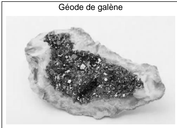
Géode de galène

Le plomb est présent à l'état naturel sous diverses formes dans la croûte terrestre. On le trouve principalement dans la galène, qui en contient 86,6 % en masse. Cet élément a permis de donner une estimation précise de l'âge de la Terre.