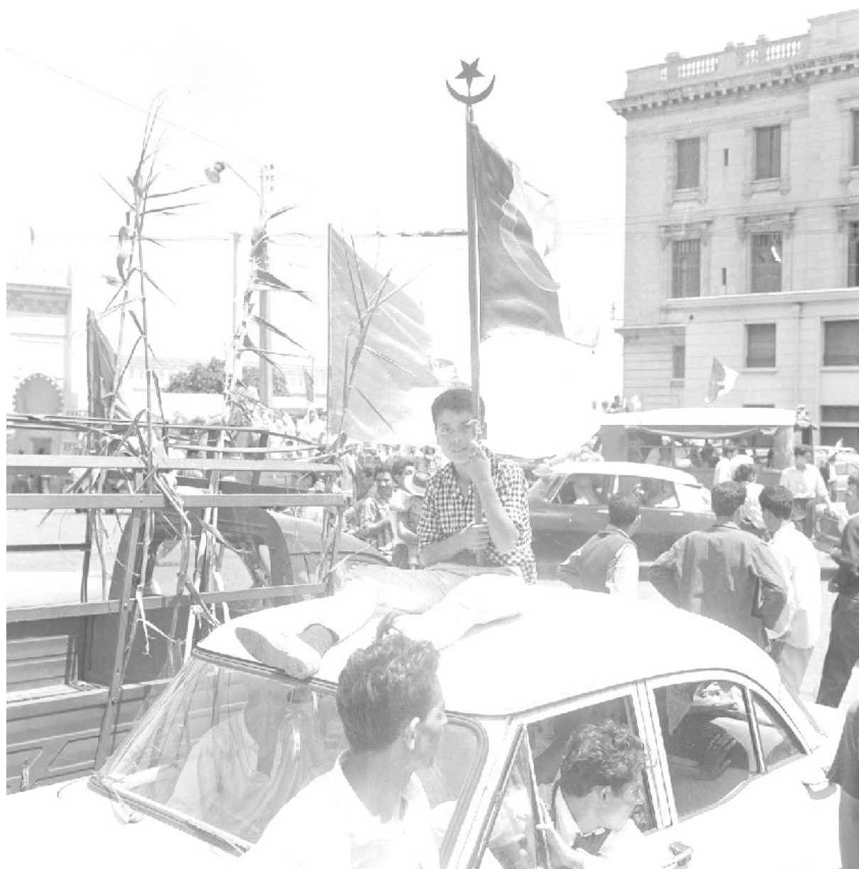
Document 2 : Manifestation à Alger le 5 juillet 1962.