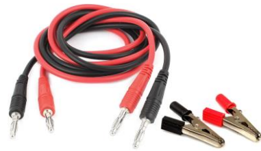
Câbles et pinces