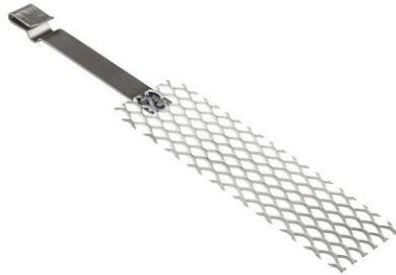
Électrode de titane platiné