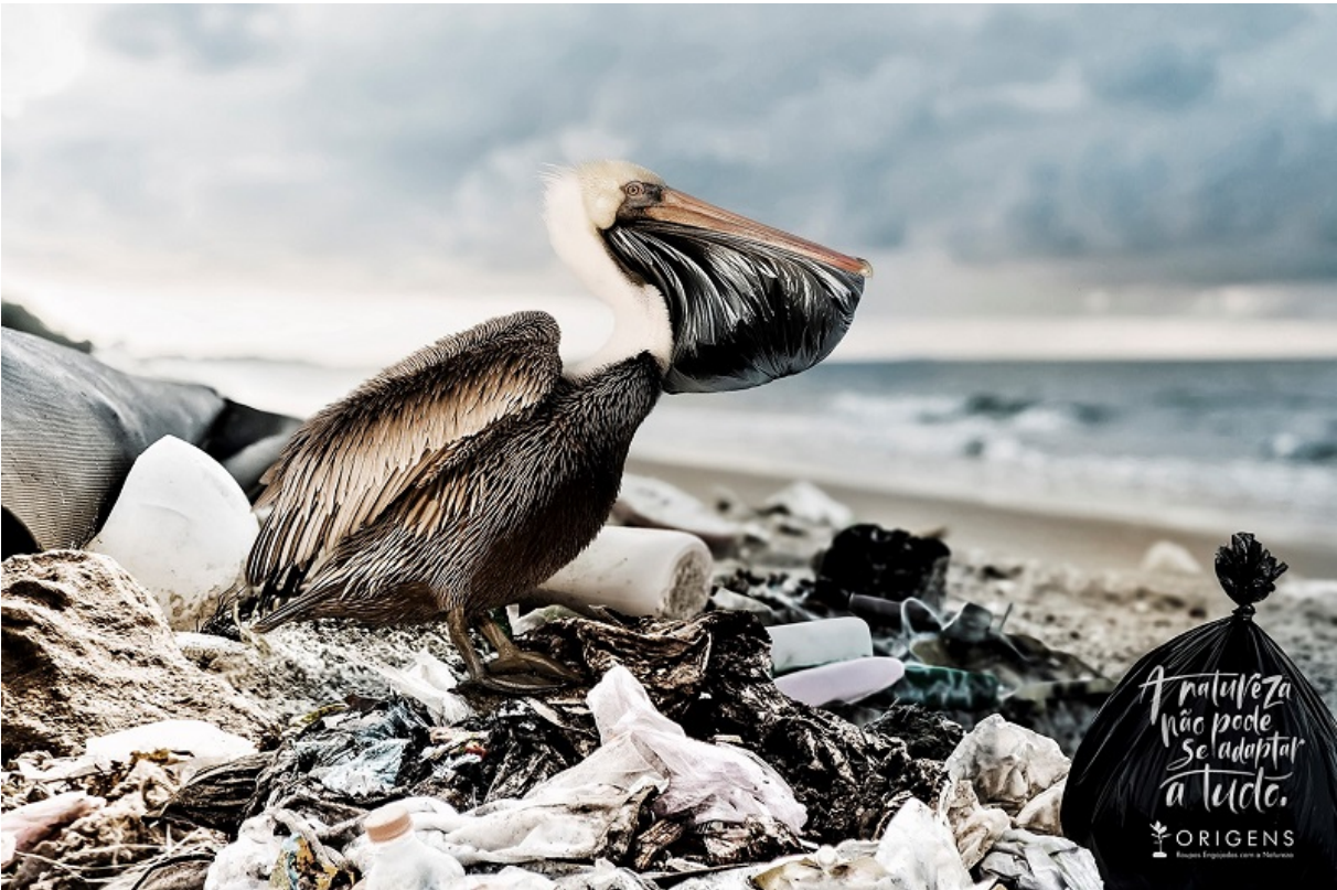
Campanha publicitária brasileira, A natureza não se pode adaptar. In, https://conexoplaneta.com.br/blog/campanha-publicitaria-sobre-alerta-ambiental-esta-entre-melhores-do-mundo