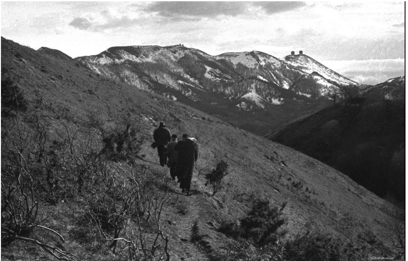
1097/14a- passage clandestin d'immigrés portugais à travers les Pyrénées - mars 1965