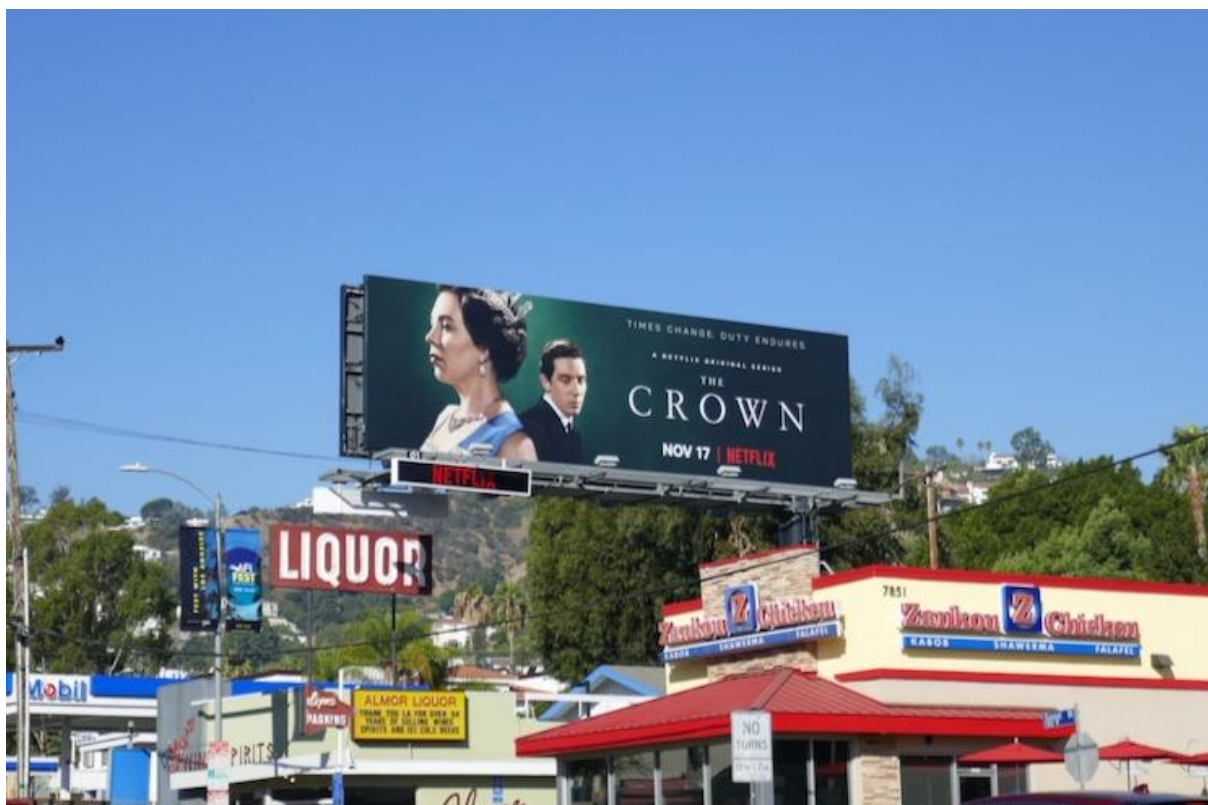
American billboard for season 3 of the TV series The Crown

Photograph taken on Sunset Boulevard, Los Angeles, November 5, 2019