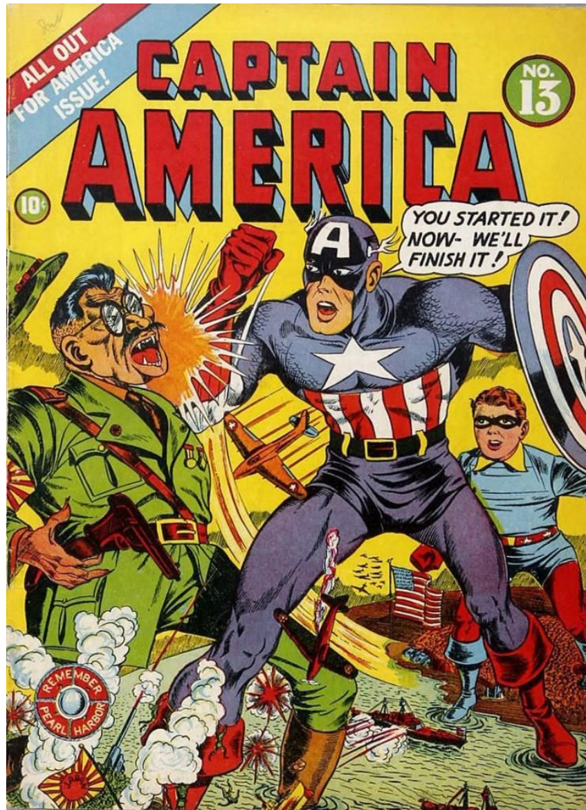
Front cover of Captain America , number 13, 1942