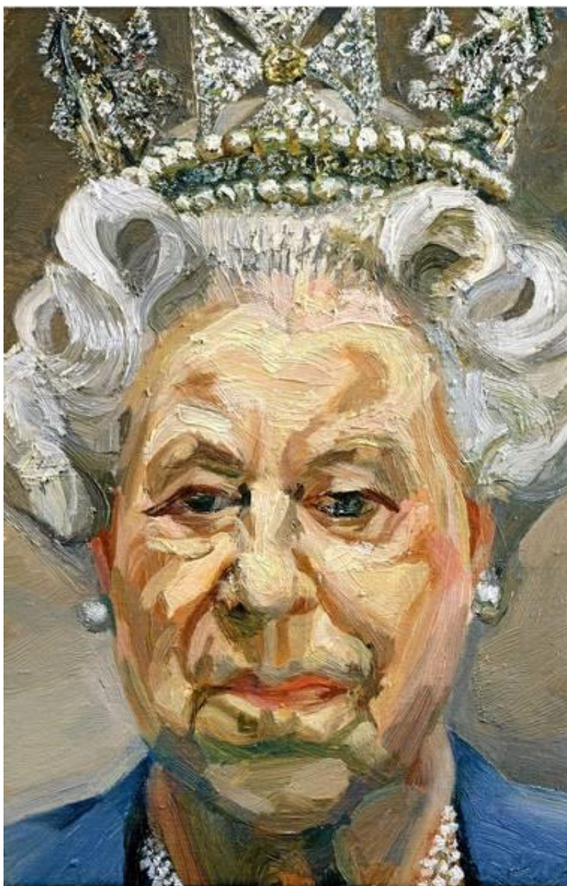
Lucian Freud (1922-2011), Elizabeth II , 2001 Oil on canvas – Royal Collection, Windsor Castle