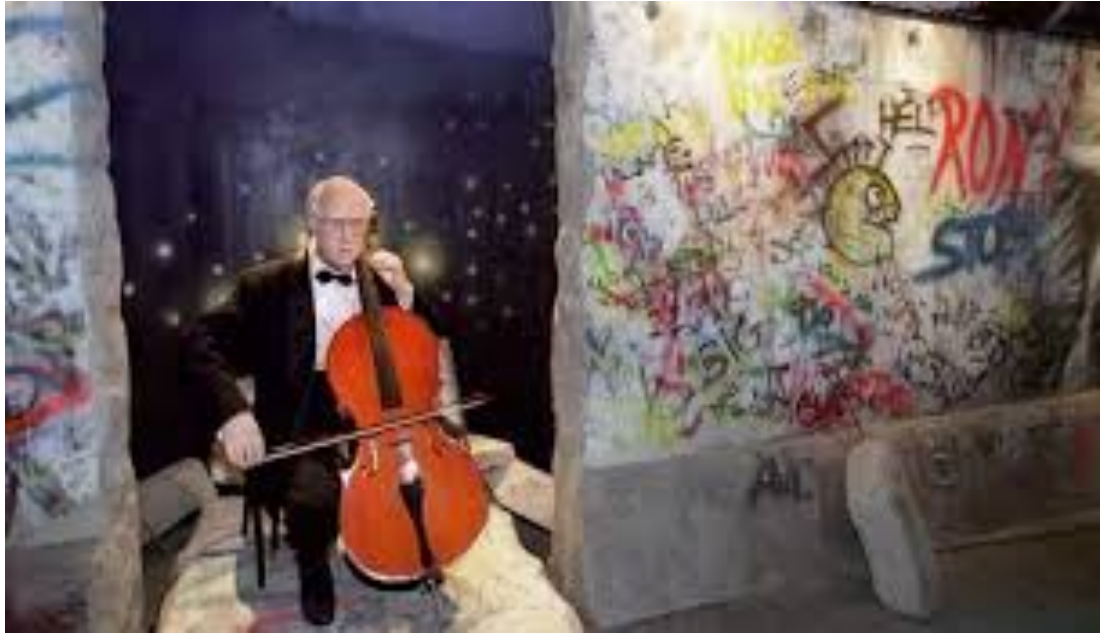
“Mauern sind nicht für ewig gebaut. In Berlin habe ich für mein Herz gespielt”, der Cellist Rostropowitsch am 11.November 1989.