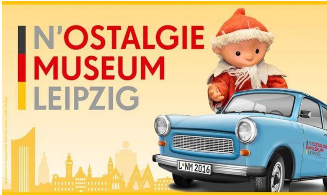
Plakat des Museums