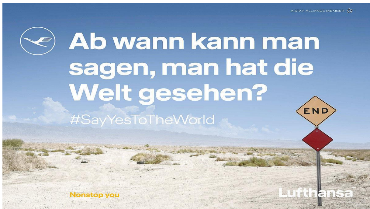
Werbepplakat - 2018 - Fluggesellschaft Lufthansa