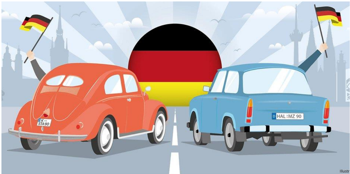
Abbildung: Ein VW-Käfer und ein Trabant: die Symbole der zwei Welten (Grafik KStA)

Aus: https://www.ksta.de/politik/west-vs--ost-zwei-blicke-auf-die-deutsche-wiedervereinigung-31385214