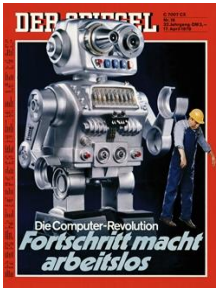
Titelseite – Die Computer-Revolution: Fortschritt macht arbeitslos – Der Spiegel, April 1978