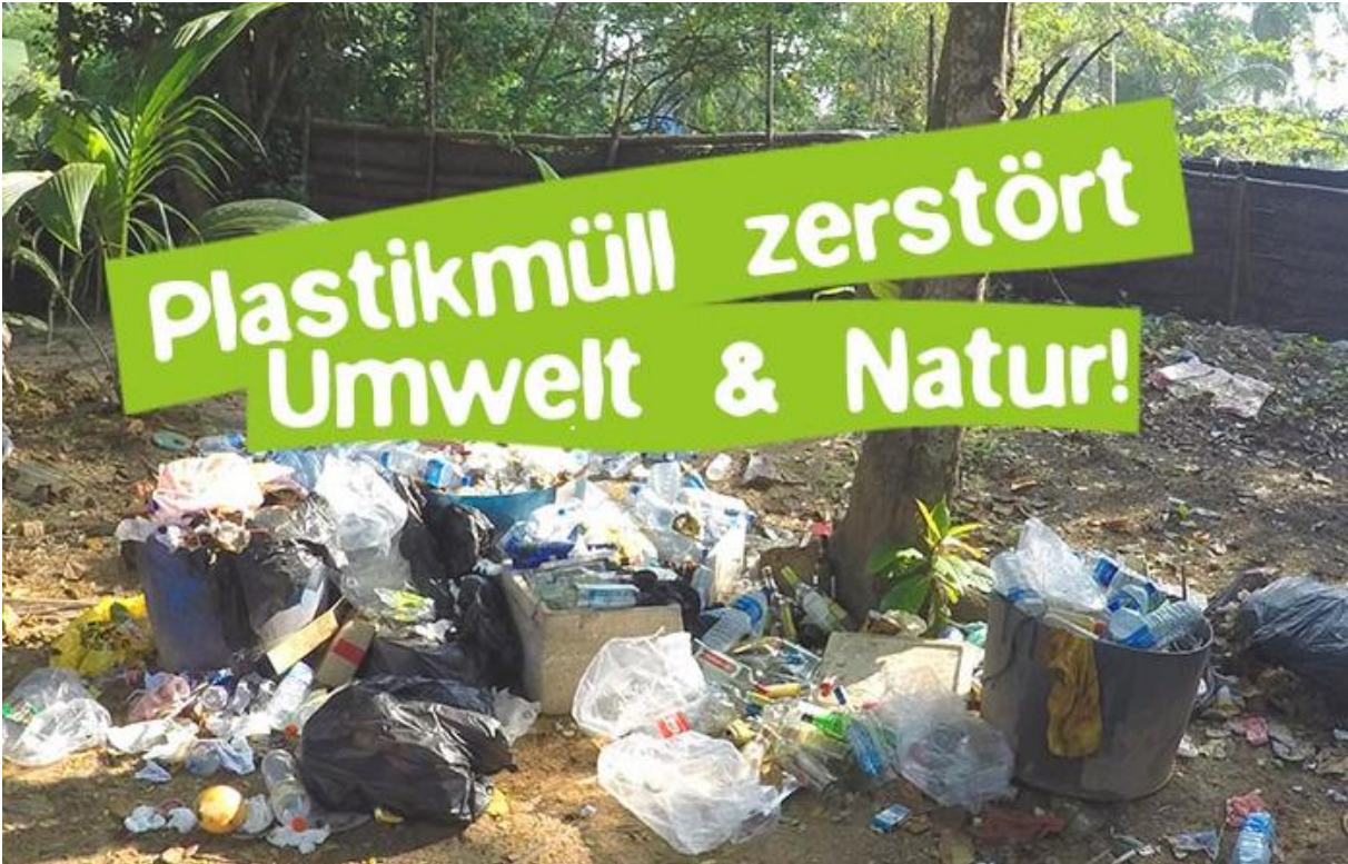
Foto aus der Webseite des Umweltschutzprojektes Careelite: „Plastikmüll zerstört Umwelt und Natur“