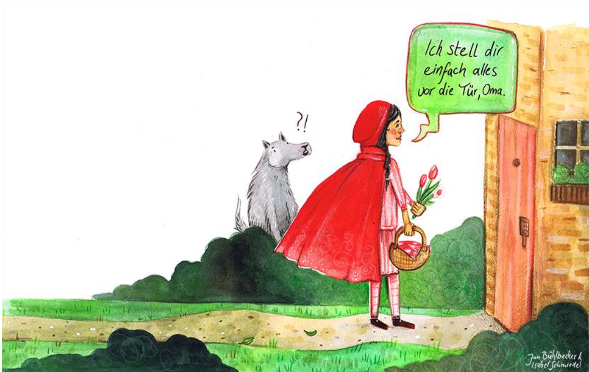
Bild – Jan Bühlbecker und Isabel Schmiedel - Comics für den Weltfrieden – April 2020 – #deutschemaerchenstrasse

Was wird aus Rotkäppchen, wenn es seine Großmutter nicht mehr besuchen kann?