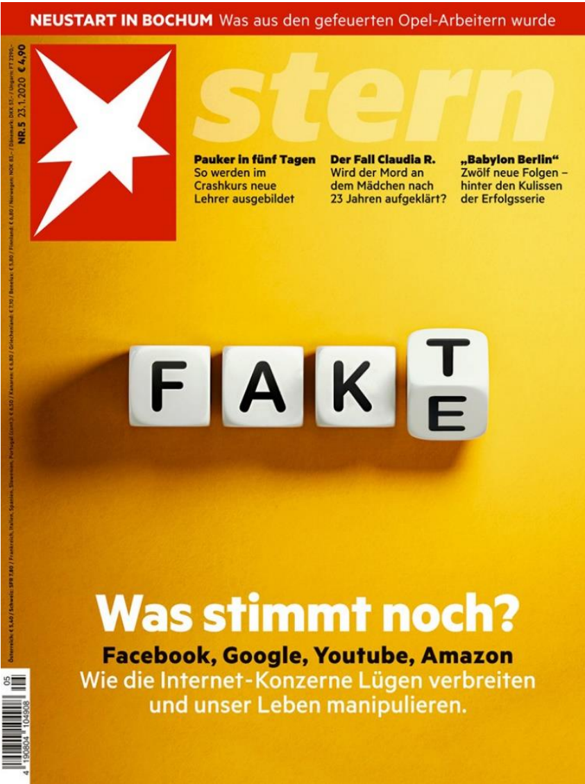
Aus : Titelblatt von der Wochenzeitschrift, Stern, Nr. 5 Januar 2020