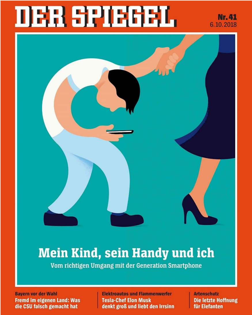
Titelseite: „Mein Kind, sein Handy und ich. Vom richtigen Umgang mit der Generation Smartphone“, Der Spiegel – Nr.41/6.10.2018

Aus: https://www.meine-zeitschrift.de/der-spiegel-44-2018.html