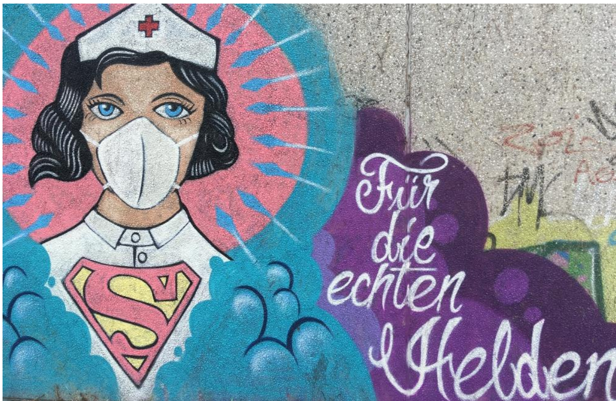
Foto – Street Art in Hamm