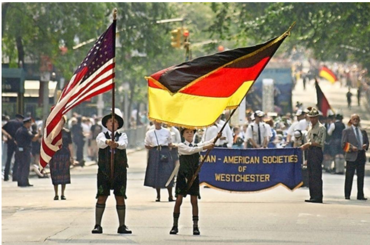
Foto – Steuben-Parade in New York

Tausende Menschen feiern einmal im Jahr die Steuben-Parade in New York. Tänzer und Musiker ziehen in deutschen Trachten durch die Straßen.