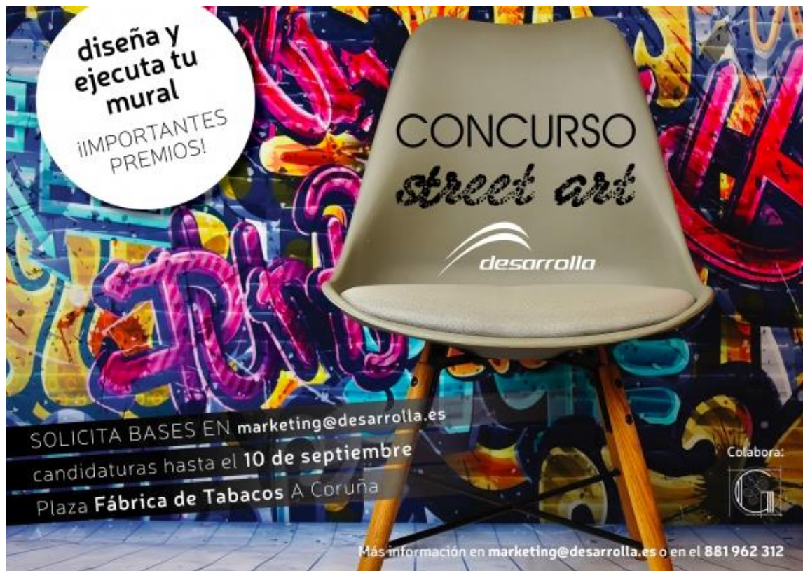
Cartel concurso de Desarrolla , empresa de construcción, 09/2018.

Apoyándose en el cartel de la empresa de construcción Desarrolla , explique qué concepciones del arte se oponen en los tres documentos.